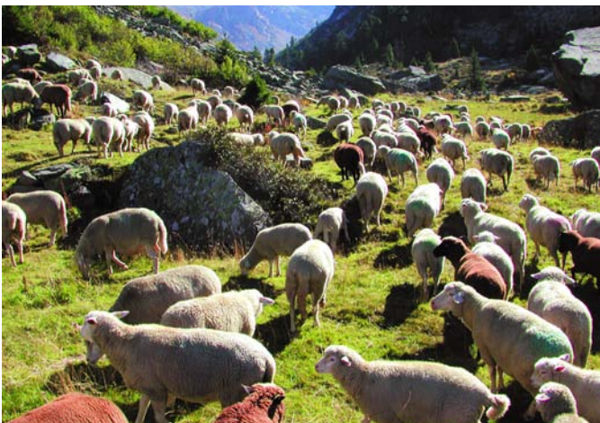
Les chiens de protection ne peuvent protéger le troupeau que si les animaux sont bien groupés.