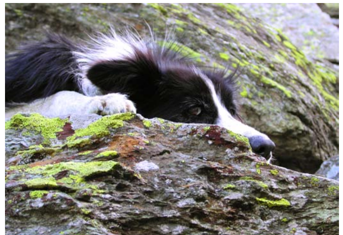
Les bons chiens de conduite regroupent les bêtes en peu de temps. C'est une condition essentielle pour la protection des troupeaux.