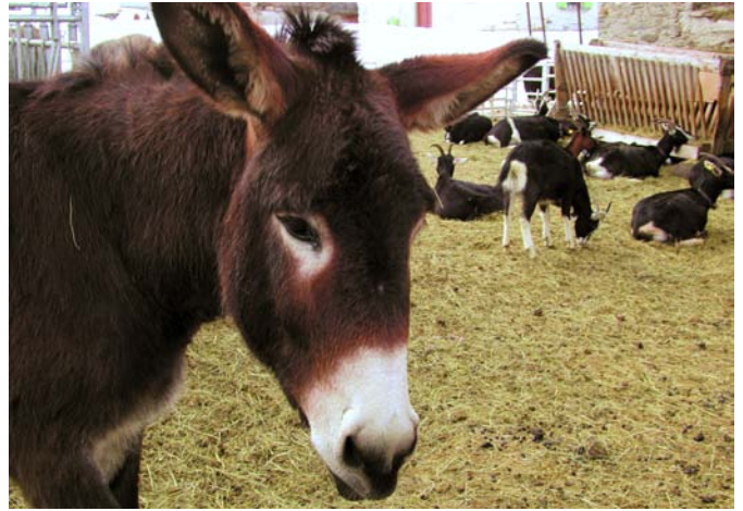
Les ânes rejettent souvent les canidés.