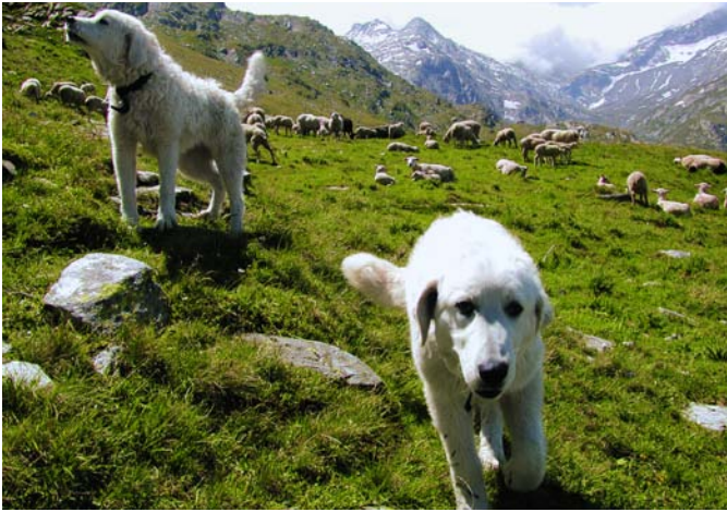
Les chiens de protection travaillent en équipe: bergers de Maremme sur l'alpe Preda-Sovrana au val Madris (GR).