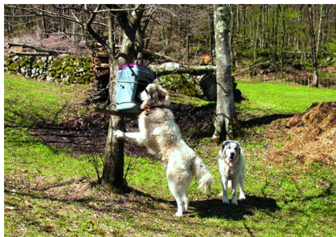
Les distributeurs automatiques de nourriture pour les chiens doivent être disposés de telle manière que les moutons ne puissent pas y toucher.