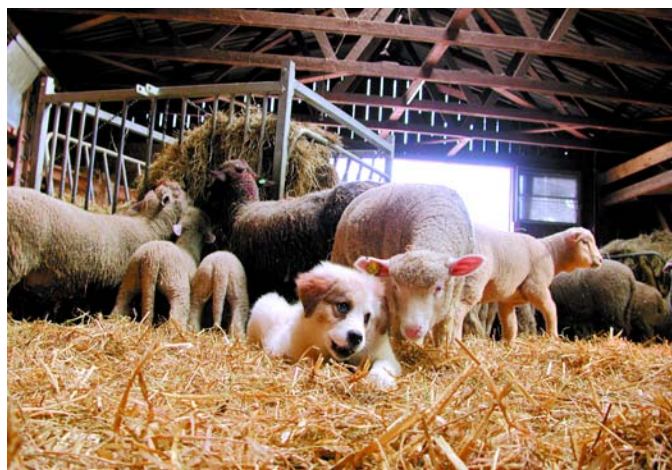
Les chiens de protection doivent grandir au contact des moutons et/ou des chèvres.