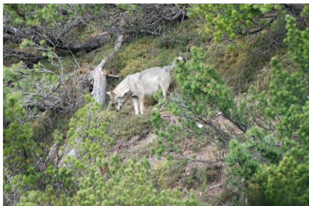
Wolf aus dem ersten Schweizer Rudel in der Calanda