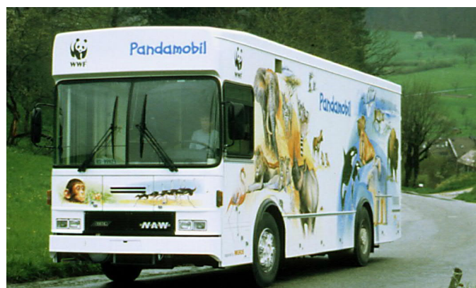
Der umgebaute Migros-Verkaufswagen Marke Mercedes

Am 8. Mai 2001 fand die Premiere mit dem neuen Pandamobil mit einer Schulklasse in Hausen am Albis statt. Die Sendung «Schweiz Aktuell» begleitet diesen Anlass und bezeichnete das Pandamobil als ein Stück Schweizer Geschichte. Am 9. Mai gab es für die Deutschschweizer Medien eine Vorstellung im Migros-Park «Im Grünen» in Rüslikon ZH, am 16. Mai für die Westschweizer Medien eine im Migros-Park «Signal-de-Bougy» in Bougy-Villars VD. Am 18. Mai begann die offizielle Tour mit dem neuen Pandamobil an der École du Château du Bois in Belfaux FR. Das Ausstellungsthema: Tropenwald.