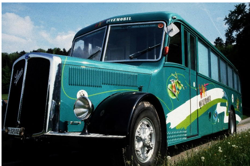
Der 1950er Saurer «en tour»

An den jeweiligen Standorten konnte die Bevölkerung an einem Quiz teilnehmen. Dazu beantworteten die Teilnehmenden Multiple Choice Fragebogen zu einem bestimmten Umweltthema. Der Moderator des Quiz war ein Mitglied des WWF Schweiz und arbeitete ehrenamtlich. Er korrigierte die Fragebögen und gab den Besuchern vertiefte Informationen auf ihre Fragen.