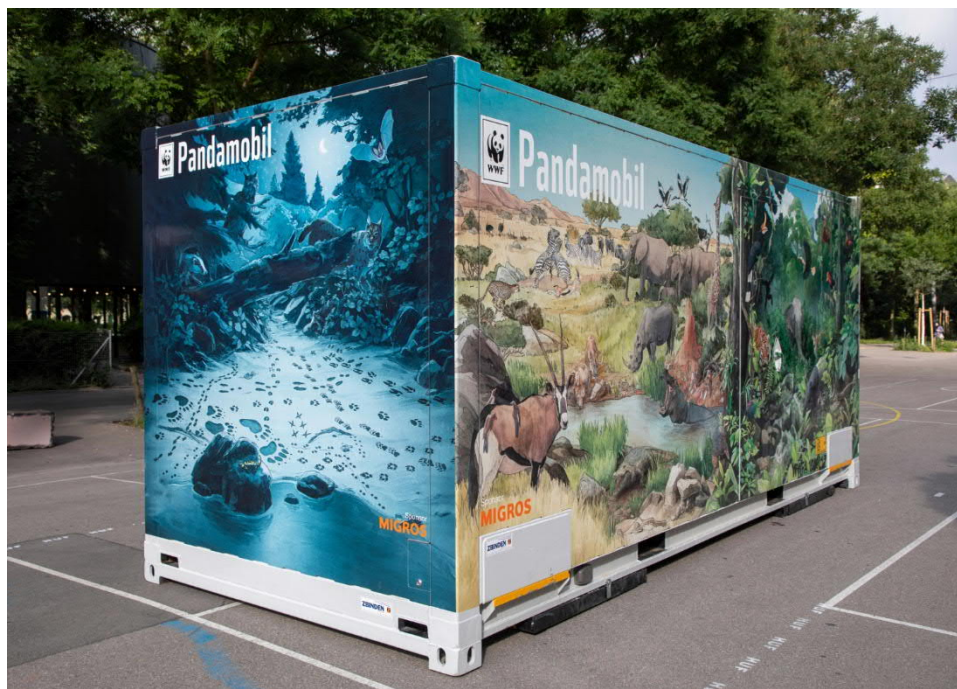
Das neue Pandamobil

Nun geht das Pandamobil in eine neue Ära: Ab August 2018 setzt der WWF bei Logistik und Ausstellungsform auf ein zeitgemässes, umweltverträgliches Konzept. Dazu wählte er einen 20-Fuss Container aus, der künftig per Zug und LKW an die Ausstellungsorte transportiert wird. Die Planung der Transporte und das Verschieben des Containers führt die Migros aus.