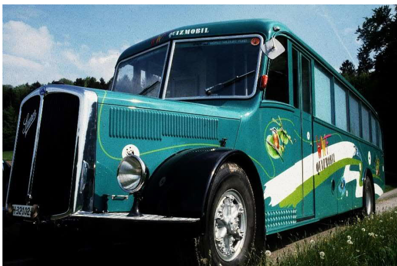
Le bus Saurer de 1950 en tournée.

Durant les haltes, la population était invitée à participer à un quiz. Il s'agissait alors de répondre à un questionnaire à choix multiple sur un thème environnemental. Le jeu était animé par un membre du WWF, qui travaillait bénévolement. Il corrigeait les questionnaires et informait les visiteurs plus en détail, répondant à leurs questions.