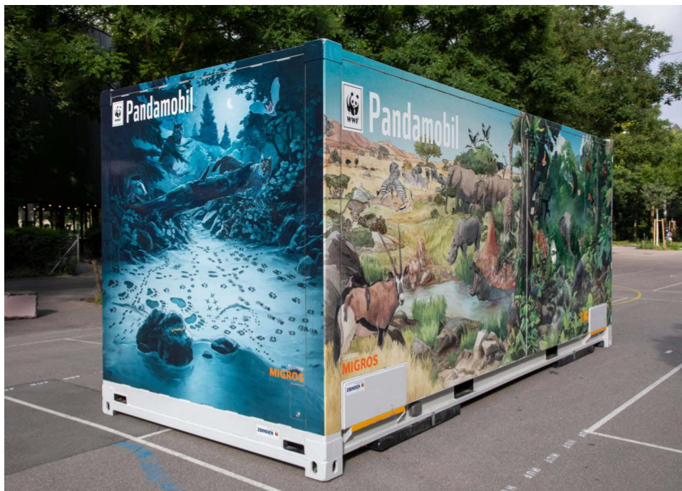
Le nouveau Pandamobil

Désormais, une nouvelle ère débute pour le Pandamobile: à partir d'août 2018, le WWF mise sur un concept moderne et écologique en matière de logistique et de forme d'exposition. Son choix s'est porté sur un conteneur de 20 pieds, qui sera à l'avenir transporté en train et par camion sur les lieux d'exposition. C'est Migros qui se chargera de la planification du transport et du déplacement du conteneur.