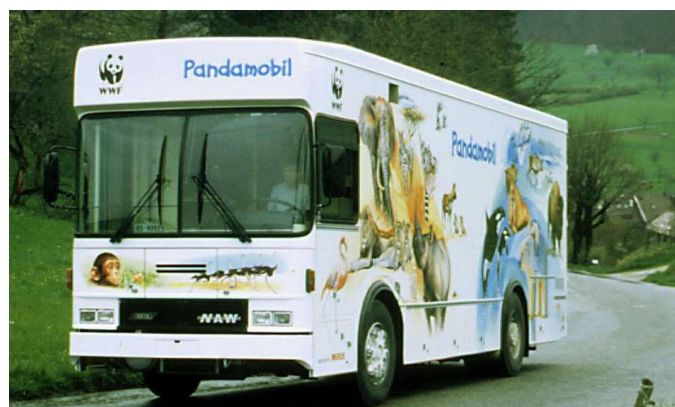
Le camion-magasin Migros transformé de la marque Mercedes.

Le 8 mai 2001, une classe de Hausen am Albis put inaugurer le nouveau Pandamobile. L'émission de la télévision alémanique «Schweiz Aktuell» accompagna l'événement et présenta alors le Pandamobile comme une page d'histoire suisse. Le 9 mai, une présentation était organisée pour les médias alémaniques dans le parc Migros «Im Grünen» à Rüschlikon ZH et le 16 mai pour les médias romands au parc Migros du «Signal de Bougy» à Bougy-Villars VD. La tournée officielle du nouveau Pandamobile débuta le 18 mai, à l'école du Château du Bois à Belfaux (Fribourg). L'exposition était alors consacrée à la forêt tropicale.