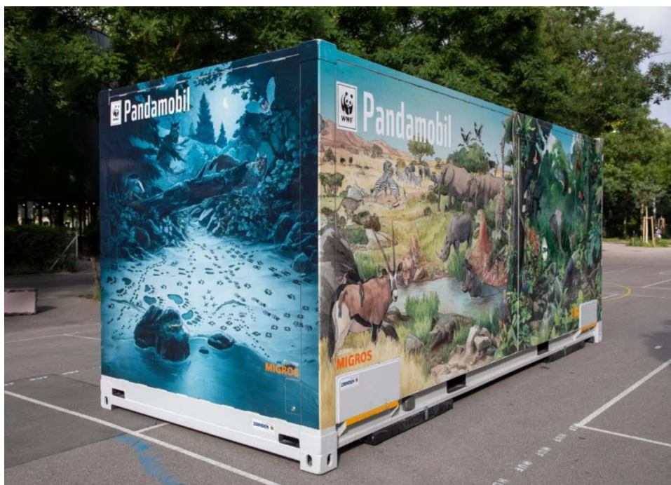
Il nuovo Pandamobil

Ora il Pandamobil sta per entrare in una nuova era: da agosto 2018, il WWF punterà su un concetto moderno ed ecologico per logistica e modalità espositiva, scegliendo un container da 20 piedi che in futuro sarà trasportato in treno e su strada fino ai luoghi espositivi. Trasporto e spostamento del container saranno a cura di Migros.