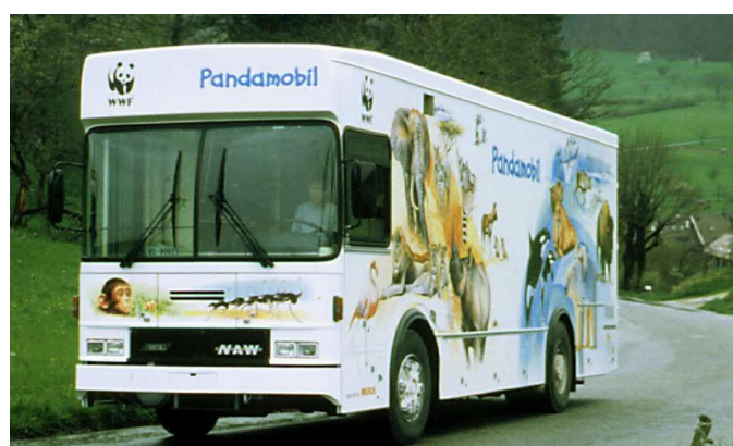
Il camion di vendita Migros marca Mercedes convertito in Pandamobil

L'8 maggio 2001 il nuovo Pandamobil viene presentato in anteprima a una classe di Hausen am Albis (Zurigo). Il programma “Schweiz Aktuell” fa la telecronaca dell'evento descrivendo il Pandamobil come un pezzo di storia svizzera. Il 9 maggio i media della Svizzera tedesca e francese tengono una presentazione rispettivamente al Parco Migros “Im Grünen” di Rüslikon, Zurigo, e il 16 maggio al Parco Migros “Signal-de-Bougy” di Bougy-Villars (Vaud). Il tour ufficiale del nuovo Pandamobil inizia il 18 maggio all'École du Château du Bois di Belfaux (Friburgo). Tema della mostra: la foresta tropicale.