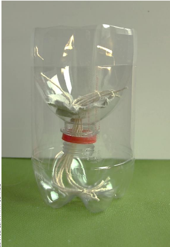
LENA DEFLOREN / WWF SCHWEIZ