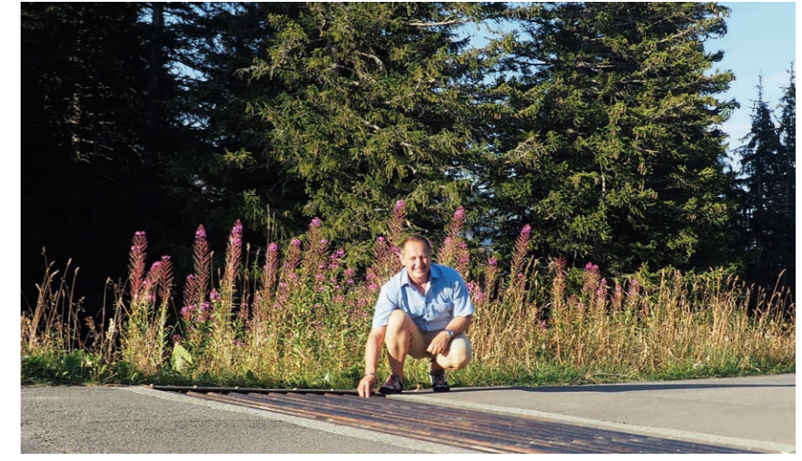
A l'avenir, les amphibiens ne périront plus dans les bovistops.