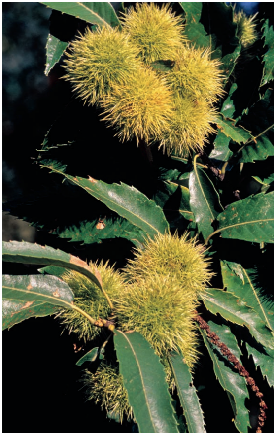
Le châtaignier, à la fois habitat, source de bois et de nourriture.

La diversité des espèces dans les Alpes vaudoises est impressionnante. Lucanes et couleuvres d'Esculape, par exemple, ont trouvé dans les forêts de châtaigniers un habitat idéal. L'association Alpes vivantes s'est donnée pour mission de protéger la faune et la flore de cet écosystème menacé.